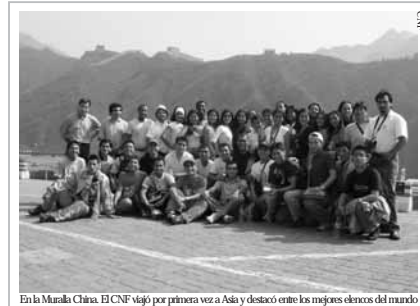
En la Murala China. El CNF viajó por primera vez a Asia y destacó entre los mejores elencos del mundo

De todo el repertorio mostrado, la Marinera norteña y la Diablada pune-