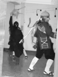
A latigazos aprendí. Singlar muestra costumbriosa de Junín con Chinchipos y Gamorales.