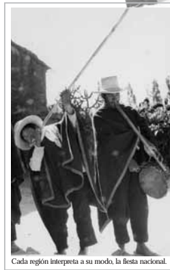
Cada región interpreta a su modo, la fiesta nacional.

Existen miles de intérpretes o artistas populares, representantes de su mundo cultural y de sus expresiones artísticas: música, canciones y danzas. Desde el inicio de su vida, practican estas y otras manifestaciones folklóricas con los de su comunidad. Su repertorio y conocimiento artístico están en estrecha relación con las prácticas comunes simbolizadas en forma colectiva y compartida. Sus ejecuciones reflejan estas características aunque se hayan