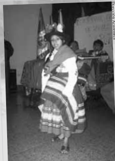
Vestida de fiesta. Niña muestra traje típico durante el I Seminario de Danzas Folklóricas de Apurímac.

La Escuela está de fiesta una vez más, y esperamos que se cumplan muchísimos años más en su incansable labor de promover y dar el verdadero valor que le corresponde a nuestro patrimonio cultural.