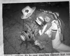
Más te quiero. Es lo que muchos dijeron tras ver esta escena de la danza Carnavala Ukia T'ikachi.