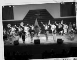
Bienvenidos. Tras su arribo desde China, el CNE abarrotó la Derrama Magisterial en la Semana Arguediana.