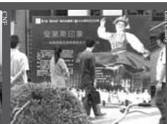
En lo alto. En una céntrica calle china, este panel invitaba al mundo a ver el espectáculo del CNF

"Y como amaba a los animales, las fiestas indias, las cosechas, las siembras con música y jarawi... me arrancaron de mi querencia, para traerme a este bullicio, donde gentes que no quiero, que no comprendo." José María Arguedas