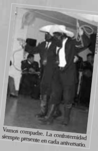
Vamos compadre. La confraternidad siempre presente en cada aniversario.