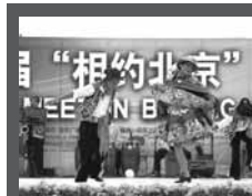
Zapatando. El Huaylarsh carnaval fue una de las danzas más aplaudidas en el distrito de Daxing.

rios como los históricos teatros de la Universidad de Beijing; de Los Trabajadores del Ferrocarril (Huhehate, Mongolia Interior), entre otros; robaron el protagonismo a importantes delegaciones artísticas del mundo, pues nuestros compatriotas realizaron un despliegue de gran nivel y atractivo visual, erigiéndose como los favoritos según la prensa local e internacional. "Estos jóvenes artistas son los verdaderos embajadores del Perú", sentenció el embajador Luis Chang.