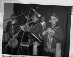
Toca mi queña. Los músicos de diversos ciclos vestidos a la usanza típica alegraron la fiesta en el día central.