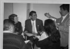
¿Y ahora? Fue muy arduo el trabajo del jurado para calificar a los mejores grupos estudiantiles.