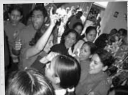
Barra brava. Momentos de júbilo y alegría tras la entrega de premios a los ganadores del concurso estudiantil.