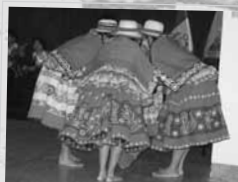
Los conatades. Pese coreográfico durante el Concurso de Danzas y Música entre los estudiantes arguedianos.