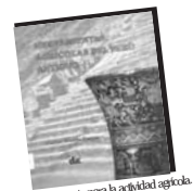
Valioso aporte para la actividad agrícola.

Por otro lado, existieron inventores e investigadores de incontables herramientas agrícolas, que lamentablemente se han perdido a través de los tiempos. Es en la época de la conquista, donde se perdieron una gran cantidad de estas, porque a los españoles sólo les interesaba el oro y la plata, la gente era obligada a trabajar en la minería y disminuyó fuertemente el número de la población.