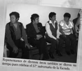
Representantes de diversas áreas también se dieron un tiempo para celebrar el 57º aniversario de la Escuela.