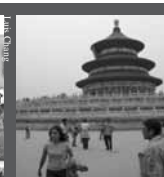
Cerca de la historia. La delegación visitó el Templo del Cielo (Beijing).