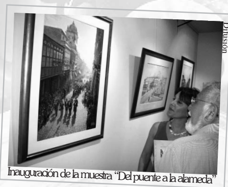
Inauguración de la muestra "Del puente a la alameda"