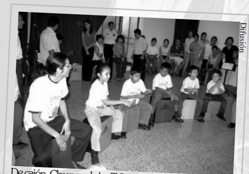
De cajón. Clausura de los Talleres de Extensión Educativa.