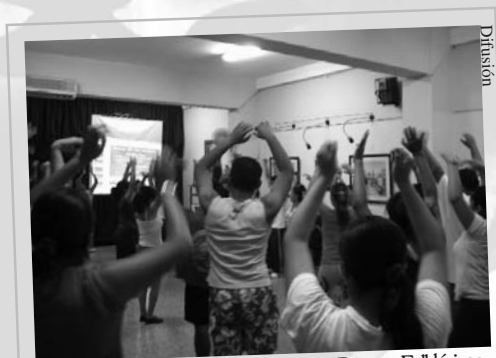
IV Taller de Capacitación Docente en Danzas Folklóricas.