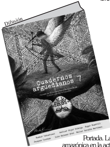
Portada. La cultura amazónica en la actualidad.

Cuadernos Arguedianos Nº 7 está referida a la vasta geografía de la selva peruana, sus recursos, biodiversidad, mitos, artes, rituales y las diversas problemáticas que enfrenta en la actualidad.