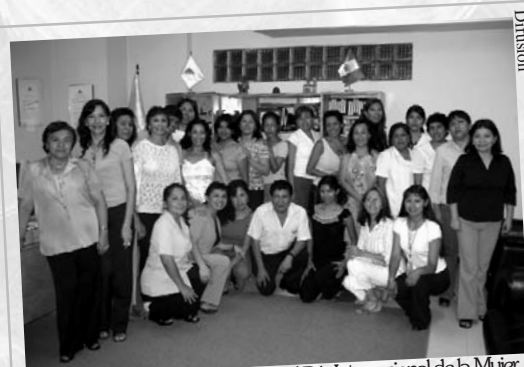
Personal de la ENSF JMA celebró el Día Internacional de la Mujer.