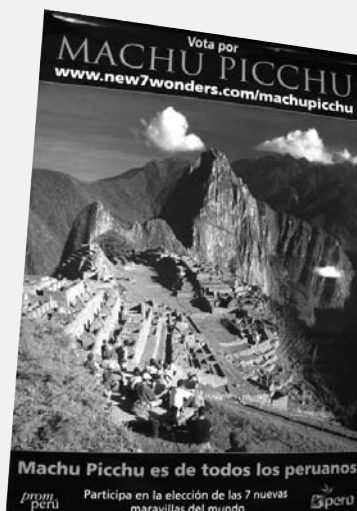
Machu Picchu en el ojo del mundo.

Campaña promovida por el MINCETUR buscará afianzar al complejo arqueológico como el más importante sitio histórico y destino turístico a nivel mundial.