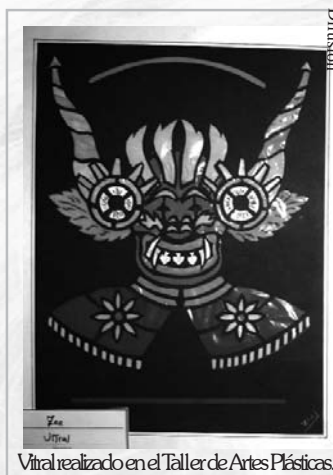
Vital realizado en el Taller de Artes Plásticas.