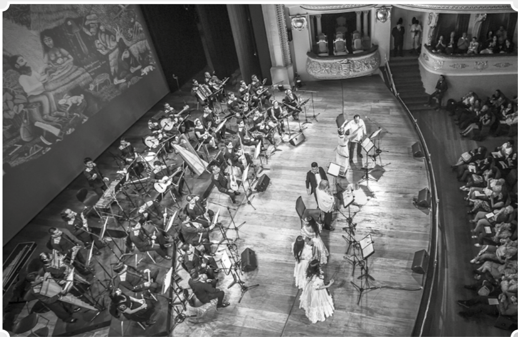
ENSAMBLE DE INSTRUMENTOS TRADICIONALES DEL PERÚ