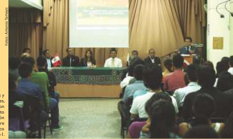
Docentes y estudiantes, se reunieron durante el acto de inauguración del semestre académico 2015-1.

Los estudiantes que obtuvieron importantes méritos académicos en el semestre anterior, recibieron un merecido reconocimiento por parte de los directivos. Para culminar la celebración, la comunidad arguediana se trasladó al frontis de la institución, para disfrutar de una muestra artística.