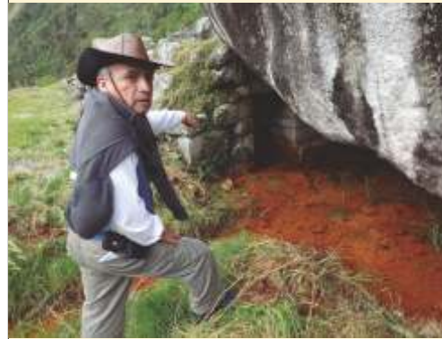
Lugar donde se encontraría enterrado Manco Inca, ubicado entre los conjuntos arqueológicos de Rosaspata y Nustahispana, en Huancacalle, Vilcabamba (Cusco).