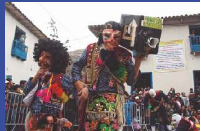
Mujeres de Pucartambo (Cusco), durante la fiesta a la Virgen del Carmen, 2014.

Por último, hay que resaltar que la “tradición inventada” es de vital importancia para entender que la innovación histórica reciente supone lo que hoy conocemos como “nación” y con esta sus fenómenos asociados. La nación está fuertemente ligada a la antigüedad, pues así no necesita una definición, sino solo una afirmación.