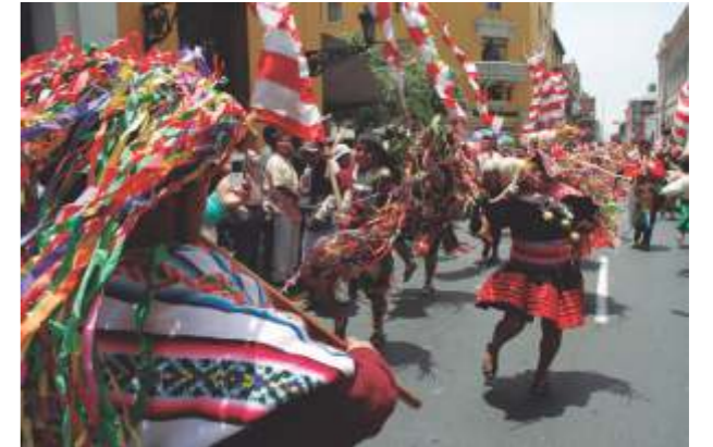
En el Perú, los carnavales se expresan con alegorías, música y danzas.

Estas fiestas se impregnaron del desorden civil, moral y la sátira, difundiéndose en los pueblos subyugados durante siglos por Roma (España, Italia, Galia), adquiriendo con el transcurrir del tiempo, diversos cambios y ajustes, siendo el más saltante el acontecido durante el feudalismo medieval, donde la Iglesia terminó por admitirlas adaptando su celebración al ritual de la cuaresma cristiana, etapa de fecha móvil (fines de enero a inicios de marzo según el año), donde los católicos son exhortados a reforzar su fe a través de actos de penitencia y reflexión.