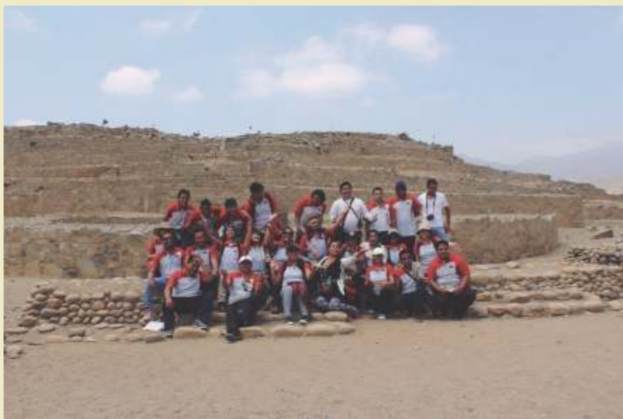
Estudiantes de PAEA MEIE visitaron la ciudadela de Caral, para llevar a cabo una investigación etnográfica.

En una de las pirámides centrales, donde se ubicaban los sacerdotes mayores, ardían los fogones, que se mantenían prendidos a través de acequias de aire labradas. Al centro de la plaza, entre varias pirámides