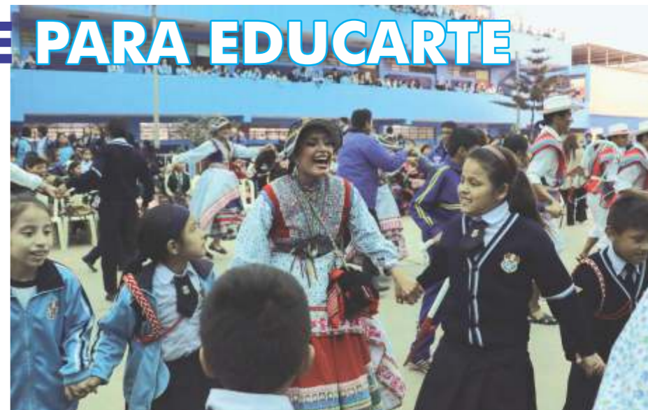
Agrupaciones oficiales de la ENSF JMA llevan funciones didácticas dedicadas a escolares de Lima.

El Conjunto Nacional de Folklore y el Ensamble de Instrumentos Tradicionales, estamentos oficiales de la ENSF JMA, así como la Escuela Nacional de Arte Dramático, entre otros, ofrecerán muestras de danza, música, teatro y artes visuales a los escolares de centros educativos ubicados en Comas, Villa María del Triunfo, Ate, San Martín de Porres, Lima, Santiago de Surco, Miraflores y San Juan de Miraflores, San Juan de Lurigancho y Barranco.