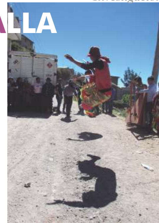
Gala mostrando actos acrobáticos ante los pobladores.

dos y por tanto a las familias que pueblan la unidad urbana así como el entorno comunal. En arquitectura, cuenta con un templo cuyo frontis está tallado en piedra de color claro y posible origen volcánico, de este mismo material se puede apreciar arquería en dos frentes de la Plaza de Armas, incluso algunas de ellas con inscripciones en castellano. Algunas viviendas ofrecen aún, algunos arcos como parte de ingreso de ambientes internos. Sobre todo el camposanto, que es visitado por los comisionados de los galas, familiares y amistades para recordar a sus fallecidos recientes, ostenta un rico arte de tallado en piedra.