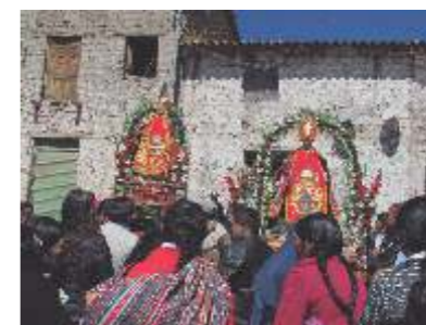
Arriba: Galas de Congalla. Abajo: Culto a San Pedro y San Pablo.