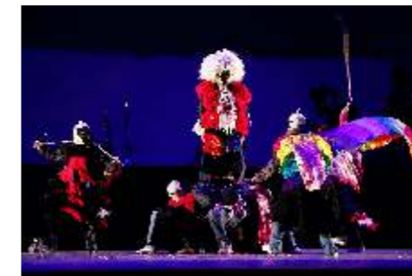
Los ukukus, personajes satíricos representativos de la obra.