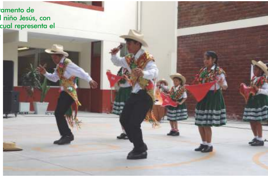
Cultores de las Huaylías de Huaytará visitaron la ENSF José María Arguedas, y deslumbraron con sus habilidades.

Las huaylías, al detenerse frente a las iglesias para adorar al niño Jesús y la Virgen María, hacen gala de sus destrezas e impresionantes coreografías. La visita de las comparsas a las autoridades, los pasa-