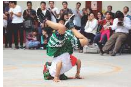
En la Huaylí, la mujer también muestra su resistencia física.

calles y pascuas de despedida, se realizan con danzas grupales y colectivas. La música que acompaña esta expresión, posee un alto grado de complejidad y está