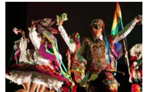
La belleza y elegancia de la danza Mestiza Qollacha.