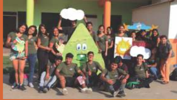
Iniciativa llevó alegría a los niños en situación de riesgo, que acoge el INABIF.