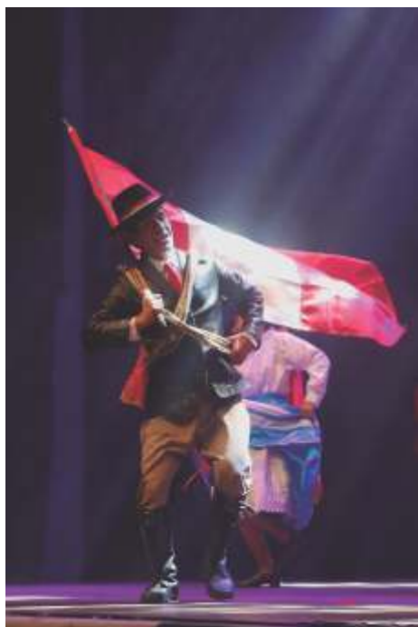
Toril de Sucre. V - A PAEA.

Entre las principales expresiones presentadas, resaltaron danzas andinas como Muliza, Huayligía y Solteritos de Paccha (Junín), Q'ajhelo (Puno), Sarawja de Carumas (Moquegua), Rodeo de