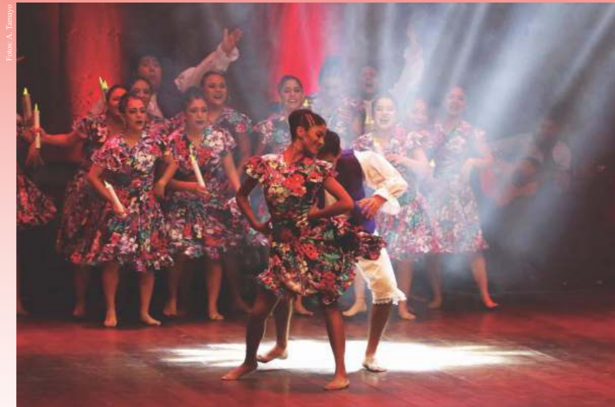
Los estudiantes arguedianos brillaron en el escenario del Gran Teatro de la UNI.

Carhuac y Huanquillas de Matacoto (Ancash), Toril de Sucre (Ayacucho), Turku Tusuy (Arequipa) y C'capac k'achampa (Cusco). Asimismo, danzas tradicionales de la costa peruana como Ingá, Alcatraz, Zamacueca y Toromata. Uno de los principales objetivos de este encuentro, es propiciar una conciencia de identidad en nuestra sociedad, mostrando cómo celebran las poblaciones del Perú, sus cultos religiosos, la reproducción del ganado, los ciclos agrícolas, festividades y rituales amorosos. En este contexto, la música está íntimamente ligada a estas expresiones, pues sin ella no existe la danza. Por ello, cabe resaltar el vital aporte de las estudiantinas, orquestas típicas, conjuntos criollos, conjuntos de instrumentos nativos y cantantes especialistas en el acervo sonoro peruano, que le otorgan un matiz especial a cada una de las muestras artísticas.