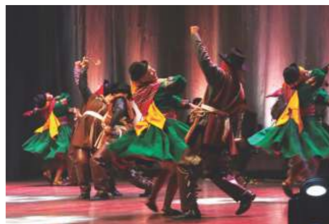
Q'ajhelo. VII - A PAEA.

Carhuac y Huanquillas de Matacoto (Ancash), Toril de Sucre (Ayacucho), Turku Tusuy (Arequipa) y C'capac k'achampa (Cusco). Asimismo, danzas tradicionales de la costa peruana como Ingá, Alcatraz, Zamacueca y Toromata. Uno de los principales objetivos de este encuentro, es propiciar una conciencia de identidad en nuestra sociedad, mostrando cómo celebran las poblaciones del Perú, sus cultos religiosos, la reproducción del ganado, los ciclos agrícolas, festividades y rituales amorosos. En este contexto, la música está íntimamente ligada a estas expresiones, pues sin ella no existe la danza. Por ello, cabe resaltar el vital aporte de las estudiantinas, orquestas típicas, conjuntos criollos, conjuntos de instrumentos nativos y cantantes especialistas en el acervo sonoro peruano, que le otorgan un matiz especial a cada una de las muestras artísticas.