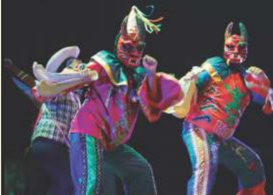
Diablos de Rioja (San Martín).

Los estudiantes del Programa de Educación Artística, Modalidad Especial de Ingreso y Estudios (PAEA MEIE), presentaron una muestra artística, en el Gran Teatro de la UNI. Cada año, más docentes con amplia experiencia (aún sin título) logran obtener la licenciatura para llevar una educación de calidad a sus centros educativos.