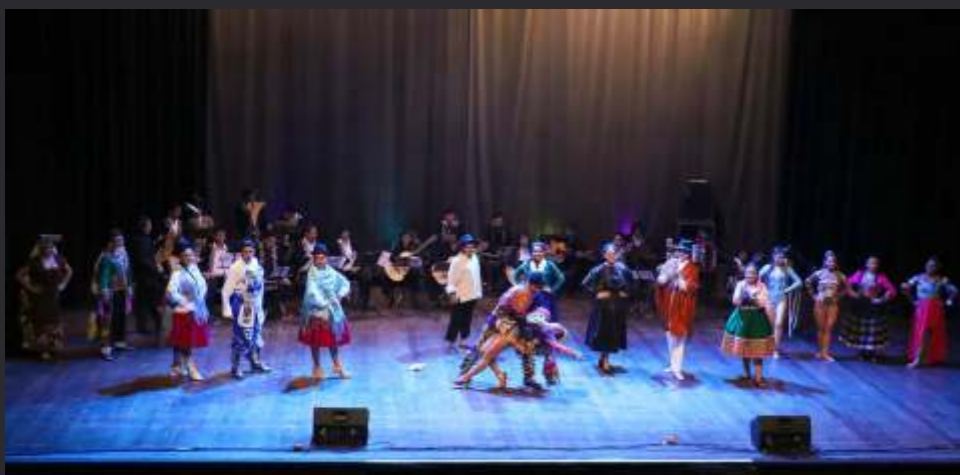
Los artistas arguedianos ofrecieron su mejor performance en el Gran Teatro de la UNI

El Ensamble Estudiantil de Instrumentos Tradicionales (EAIT) de la Escuela, presentó en el Gran Teatro de la UNI, el concierto "Entre ritmos y cuerpos", con la participación de los estudiantes arguedianos, que cursan el VII ciclo del Programa Académico de Artista Profesional - Danza, como parte del desarrollo de sus prácticas pre profesionales, quienes desarrollaron performances escénicas inspiradas en los temas que interpretó el Ensamble Estudiantil. Una novedosa propuesta que mostró la vital relación entre la música y el movimiento corporal.