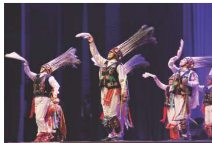
Huanquillas de Matacoto. IX A PAEA.