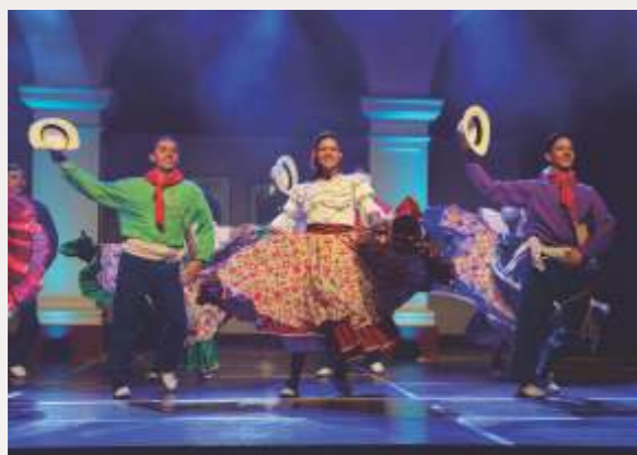
El Festival busca hermanar culturas a través del arte y la danza.

Diversos países de América se reunirán para mostrar sus expresiones culturales en la tercera edición de este certamen internacional. Nuestros artistas arguedianos representarán al Perú.