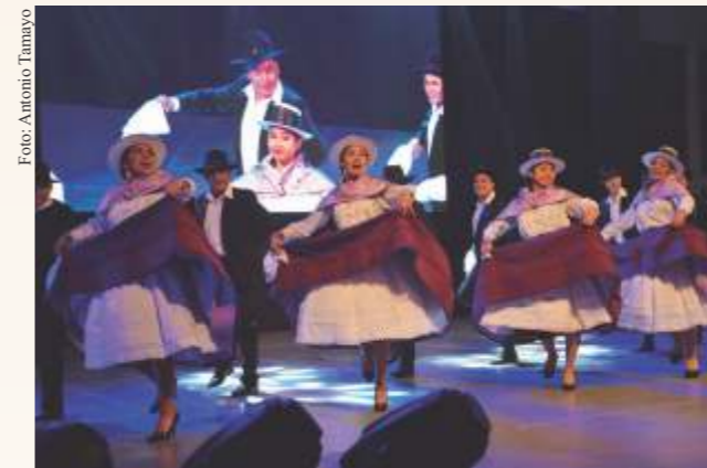
Arriba: Elenco de Danzas de la ENSF José María Arguedas. Der.: La Dama de Cao escenificada por la compañía Máscara de Barro.

Espectáculo que integra música, danzas y teatro, se presentará en la ciudad de Trujillo. Con la participación estelar de los artistas de la ENSF José María Arguedas, ESAD Virgilio Rodríguez Nache y Compañía de Teatro Máscara de Barro. Entradas en Teleticket.