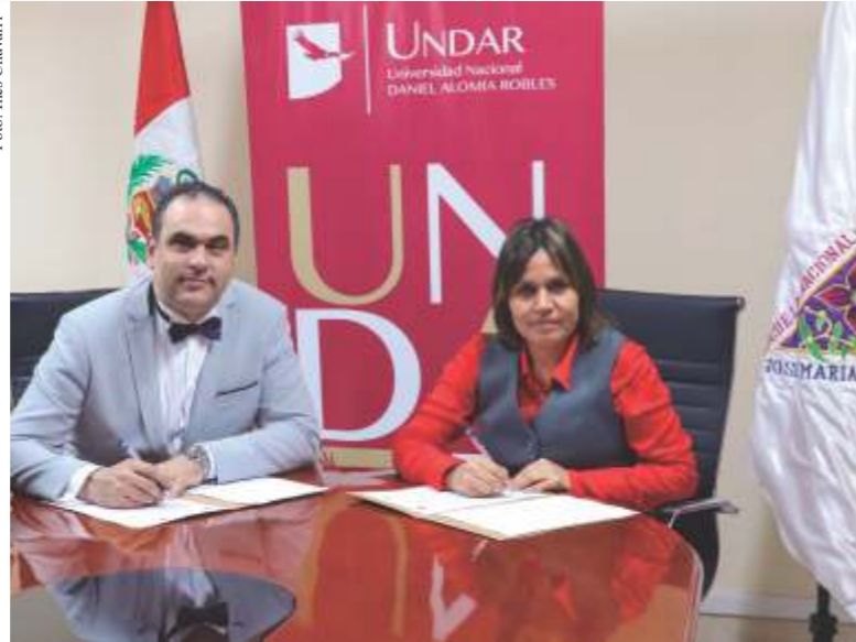
Directivos de ambas entidades durante firma del convenio.

El acuerdo permitirá además, que los docentes, estudiantes e investigadores de las instituciones firmantes, desarrollen la producción y publicación de material bibliográfico como libros o revistas referidos a la danza, la música, la pedagogía y la cultura tradicional del Perú; respetando la propiedad intelectual del autor o autores.