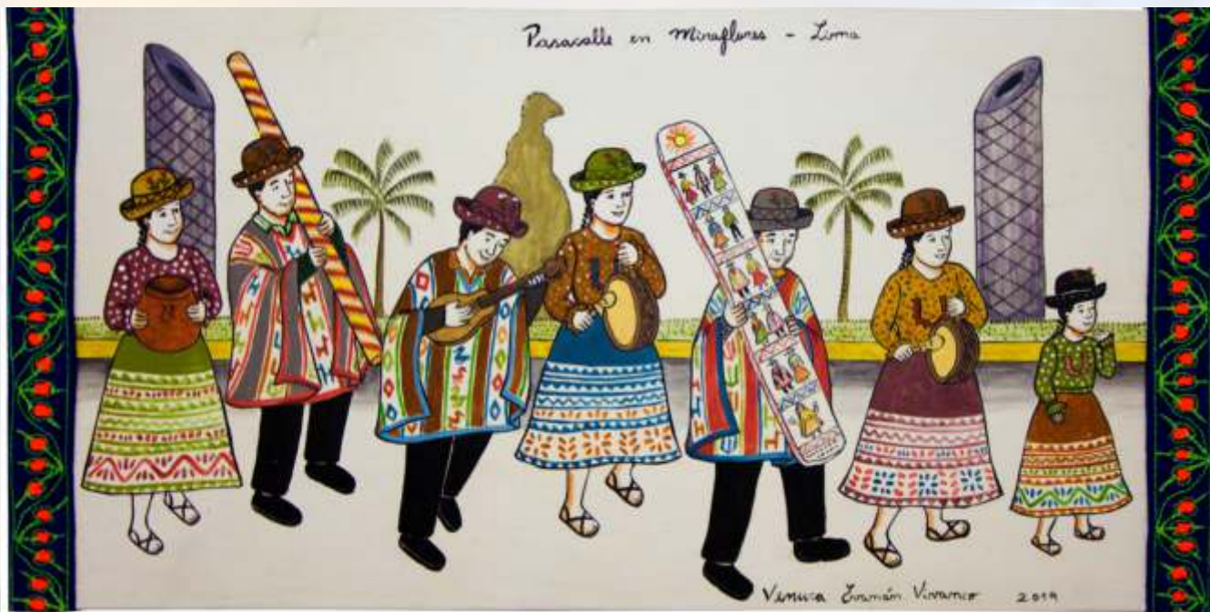
Pasacalle en Miraflores, 2019. Obra de la artista Venuca Evanán, que representa la adaptación de la población de Sarhua (Ayacucho) a la capital.