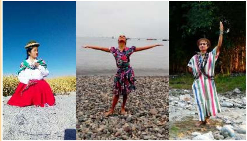
Uniendo raíces. Integrantes del Pre CNF, alternarán de forma virtual con los músicos del CMC y CAA.