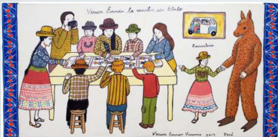
Emprendimiento de la mujer sarhuina en la ciudad de Lima a través del arte y la cultura. Obra de Venuca Evanán.