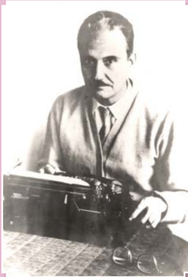
JOSÉ MARÍA ARGUEDAS (1911-1969)